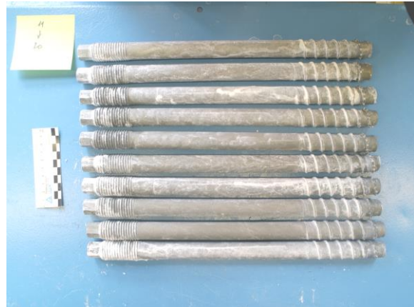
Bild 3 Prüfmuster 11-20 Nach 4800 Stunden Salzsprühnebelprüfung