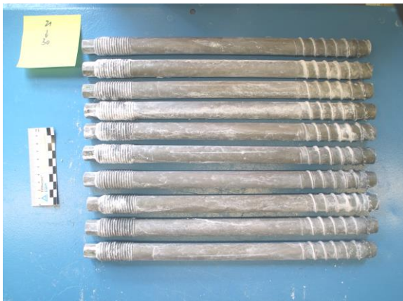
Bild 4 Prüfmuster 21-30 Nach 4800 Stunden Salzsprühnebelprüfung