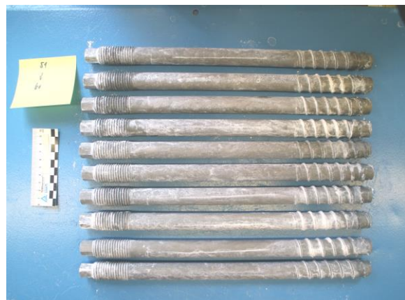
Bild 7 Prüfmuster 51-60 Nach 4800 Stunden Salzsprühnebelprüfung