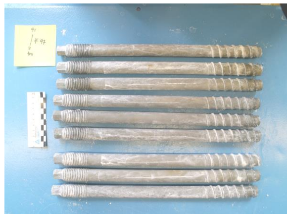
Bild 11 Prüfmuster 91-100, ohne Prüfteil 97 Nach 4800 Stunden Salzsprühnebelprüfung