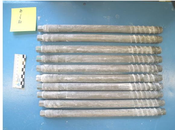
Bild 9 Prüfmuster 71-80 Nach 4800 Stunden Salzsprühnebelprüfung