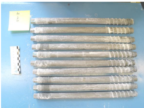
Bild 6 Prüfmuster 41-50 Nach 4800 Stunden Salzsprühnebelprüfung