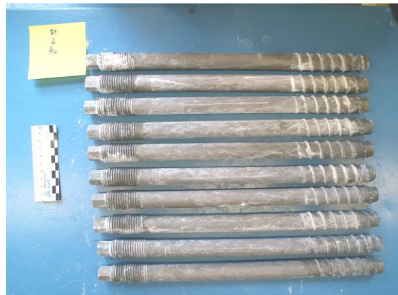
Bild 5 Prüfmuster 31-40 Nach 4800 Stunden Salzsprühnebelprüfung