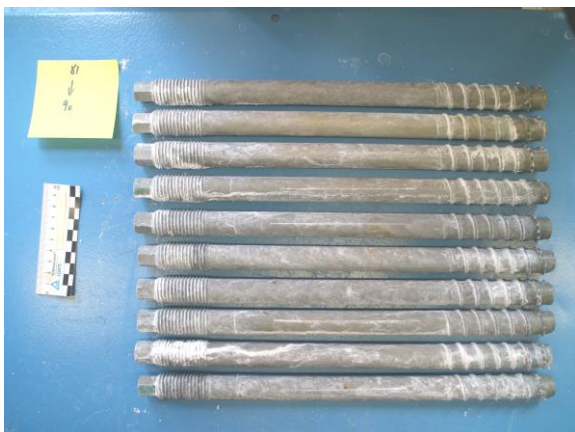
Bild 10 Prüfmuster 81-90 Nach 4800 Stunden Salzsprühnebelprüfung