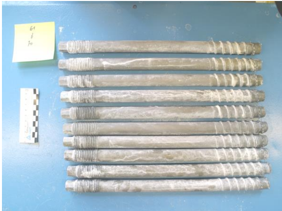
Bild 8 Prüfmuster 61-70 Nach 4800 Stunden Salzsprühnebelprüfung