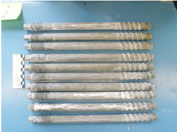
Bild 2 Prüfmuster 1-10 Nach 4800 Stunden Salzsprühnebelprüfung